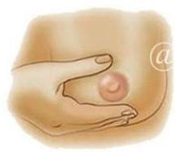
Posisikan tangan membentuk huruf "C"