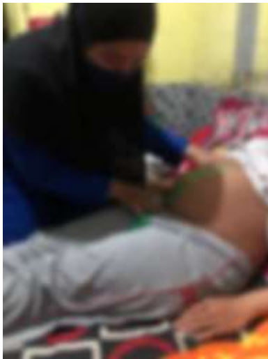
Kunjungan kedua dilakukan di rumah Ny."H"