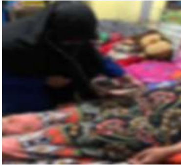
Pemeriksaan fisik pada ibu hamil kunjungan pertama