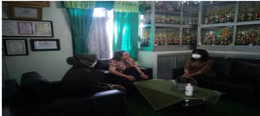
Koordinasi kegiatan dengan kepala sekolah