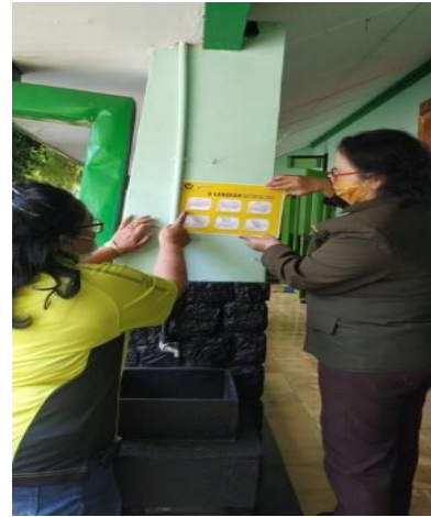
Pemasangan poster cuci tangan