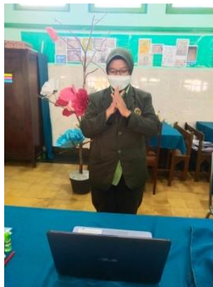
Demonstrasi cuci tangan