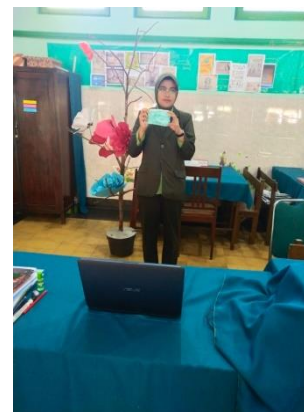
Demonstrasi penggunaan masker yang benar