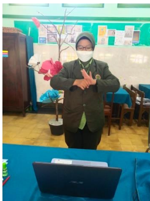
Demonstrasi cuci tangan