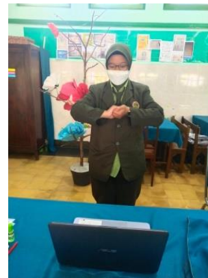
Demonstrasi cuci tangan