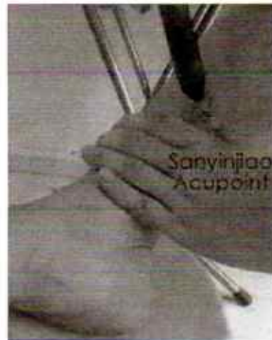
Moksibasi pada Titik Akupunktur SP 6.