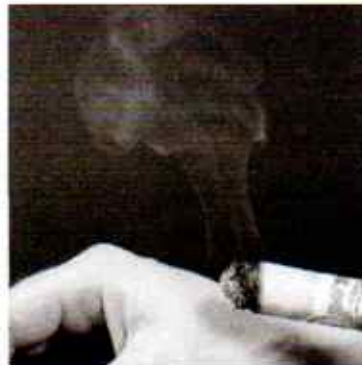
Moksibusi pada Titik Akupunktur LI 4.