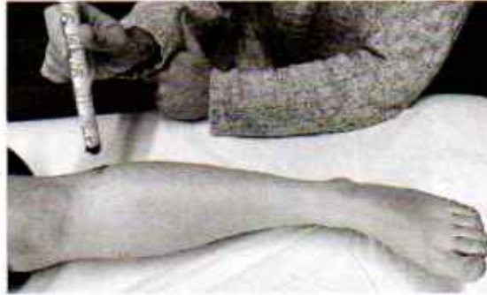
Moksibasi pada Titik Akupunktur ST 36.