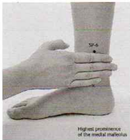
Titik Akupunktur SP 6.