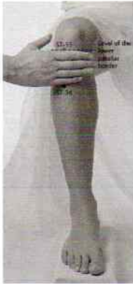
Titik Akupunktur ST 36.