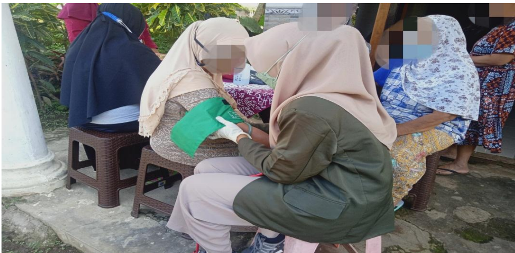
Gambar 5.2 Pengukuran Tekanan Darah pada lansia di posyandu lansia