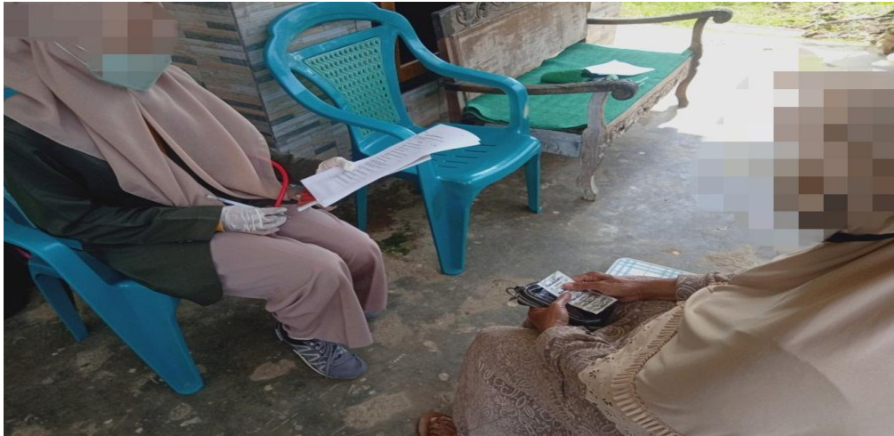
Gambar 5.1 Pengisian Kuesioner GDS responden dibantu oleh peneliti

Pengumpulan data pada tanggal 12 Januari 2022 di Posyandu Lansia Desa Banjarejo Kecamatan Pakis Kabupaten Malang