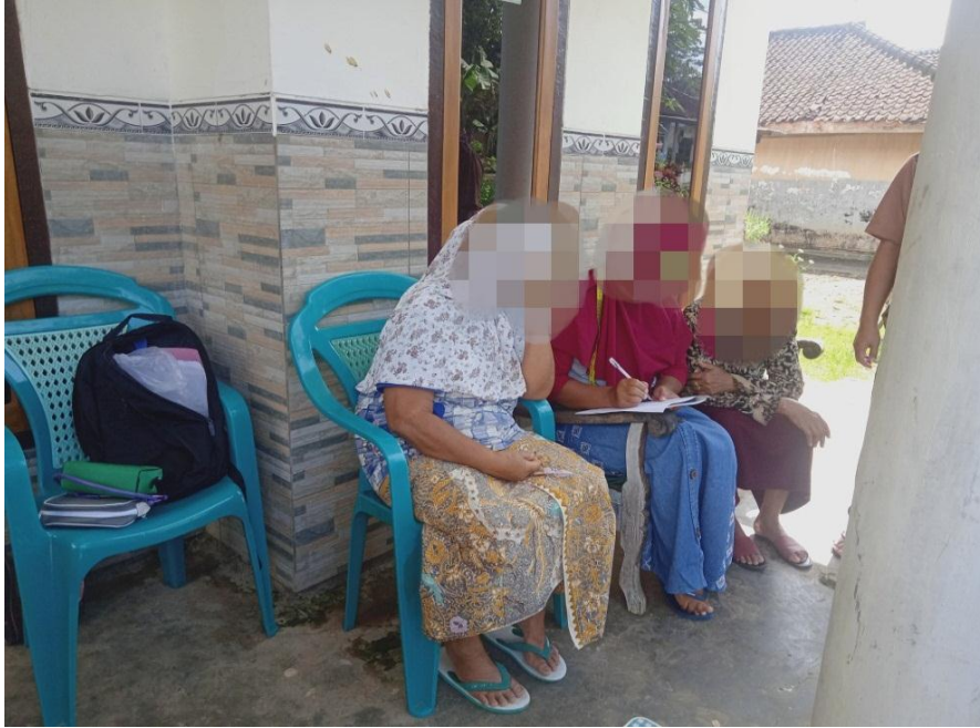
Gambar 5.1 Pengisian Kuesioner GDS responden dibantu oleh kader posyandu lansia