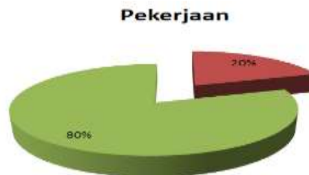
Gambar 5.3 Data Pekerjaan

Berdasarkan data di atas dapat diketahui bahwa sebagian besar ibu hamil tidak bekerja sebanyak 72%. Hal ini sesuai dengan pernyataan bahwa salah satu faktor yang mempengaruhi pengetahuan adalah informasi. Seseorang yang mempunyai informasi yang lebih banyak akan mempunyai pengetahuan yang lebih luas. Media cetak dan elektronik dapat memberikan informasi yang cepat di masyarakat.