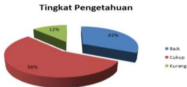
Gambar 5.4 Data Pengetahuan Ibu Hamil Sebelum Pelatihan

Berdasarkan data di atas dapat diketahui bahwa sebelum dilakukan pelatihan, didapatkan data sebanyak 56% tingkat pengetahuan cukup.