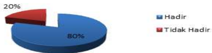
Gambar 5.1 Data Jumlah Ibu Hamil

Berdasarkan hasil pelaksanaan kegiatan Pemberdayaan Ibu Hamil Dalam Persiapan Persalinan Pada Era Pandemi Covid-19 yang telah dilakukan oleh dosen pelaksana yang berlokasi di PMB Yuni Ermawati Desa Sipring Kecamatan Pagelaran dengan peserta ibu hamil sebanyak 20 orang. Diketahui juga bahwa sebagian besar dari ibu hamil belum pernah mendapatkan informasi tentang persiapan persalinan pada era pandemic Covid-19.