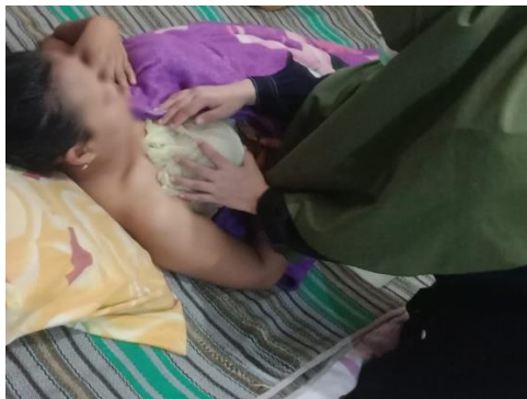
Hari ke-1 kompres daun kubis