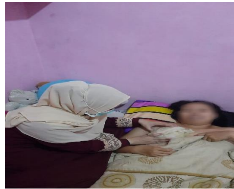
Hari ke-2 kompres daun kubis