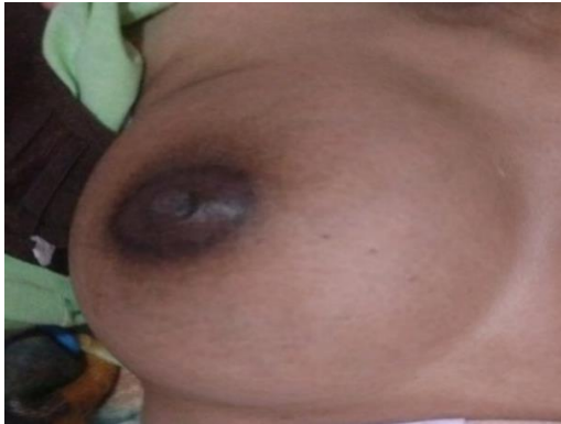
Hari ke-1 sebelum intervensi