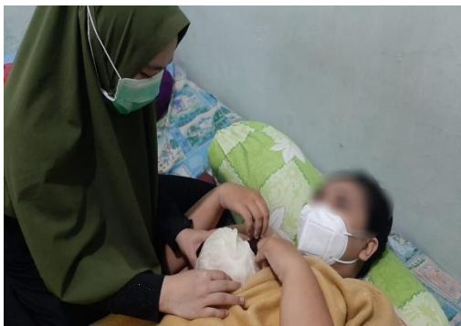
Hari ke-1 kompres daun kubis