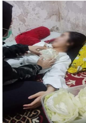
Hari ke-2 kompres daun kubis