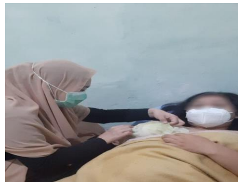
Hari ke-2 kompres daun kubis