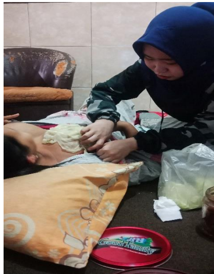
Hari ke-3 kompres daun kubis