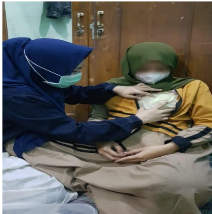
Hari ke-1 kompres daun kubis