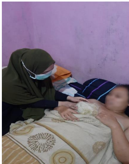
Hari ke-3 kompres daun kubis