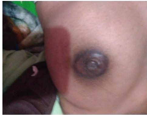
Hari ke-3 setelah intervensi