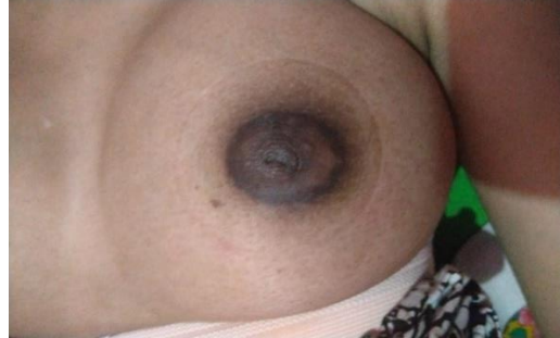
Hari ke-3 setelah intervensi