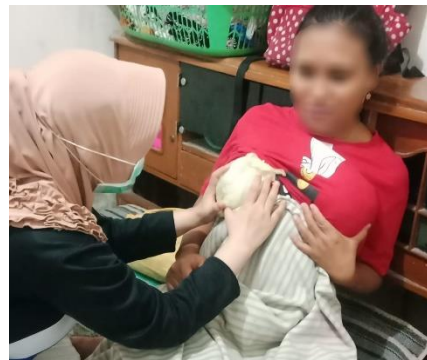
Hari ke-2 kompres daun kubis