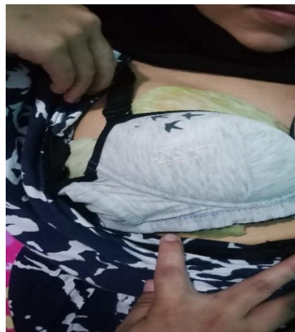
Hari ke-3 kompres daun kubis