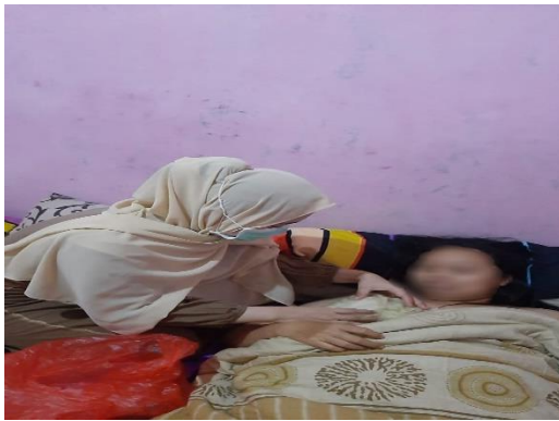
Hari ke-1 kompres daun kubis