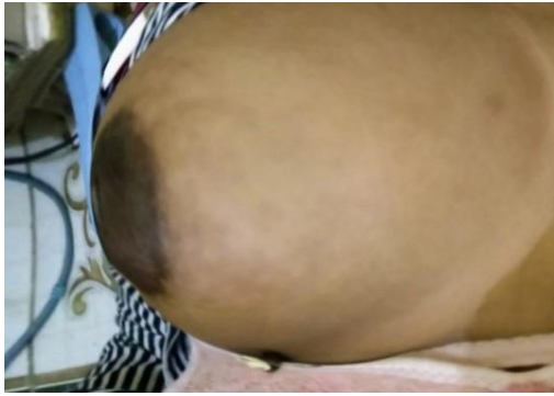
Hari ke-1 sebelum intervensi