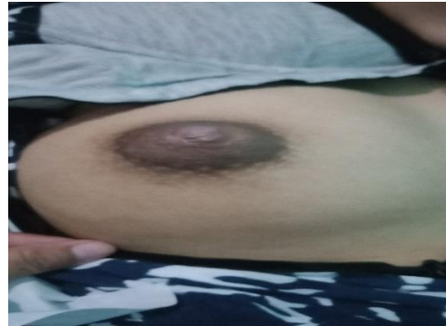
Hari ke-3 setelah intervensi