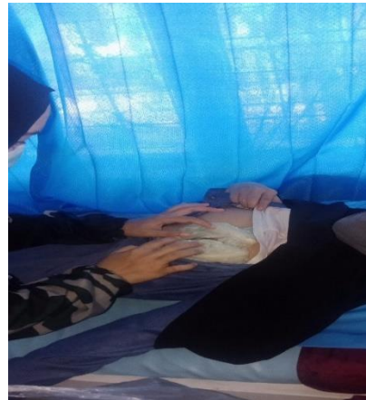
Hari ke-2 kompres daun kubis