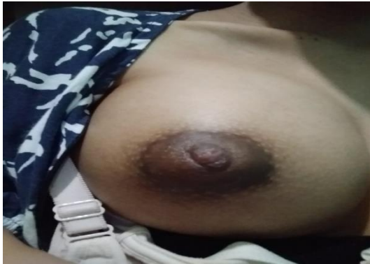
Hari ke-1 sebelum intervensi