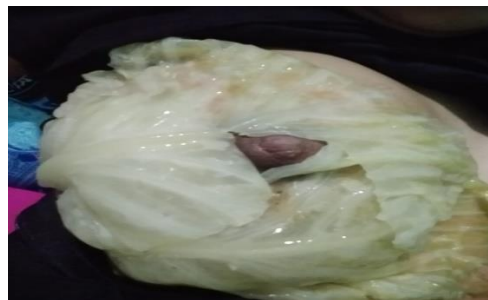
Hari ke-3 kompres daun kubis