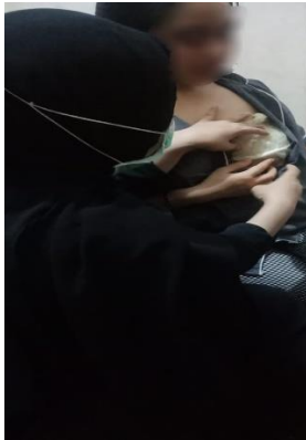
Hari ke-1 kompres daun kubis