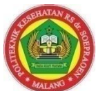
Lampiran 10 : Lembar Dokumentasi