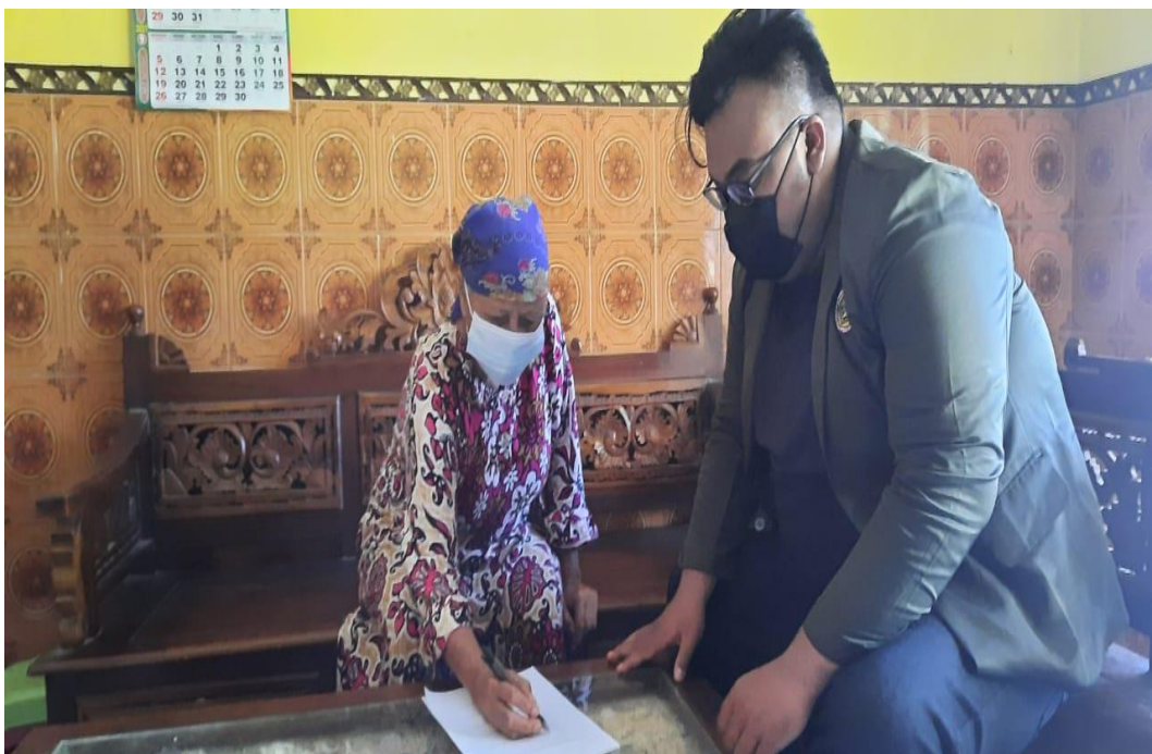
Mendampingi responden dalam mengisi kuesioner dan memastikan semua kuesioner terisi penuh