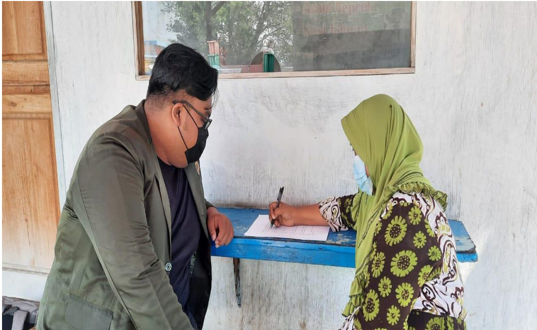
Mendampingi responden dalam mengisi kuesioner