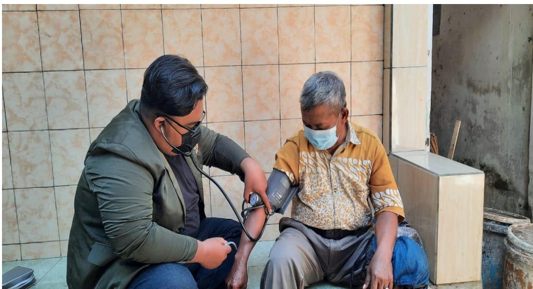
Kegiatan menensi responden sebelum mengisi kuesioner pada responden A