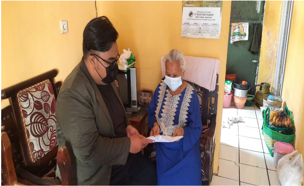
Menyerahkan kuesioner kepada responden