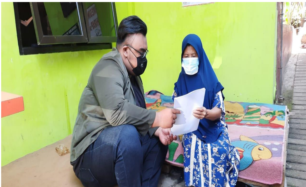
Menyelaskan kepada responden cara mengisi kuesioner