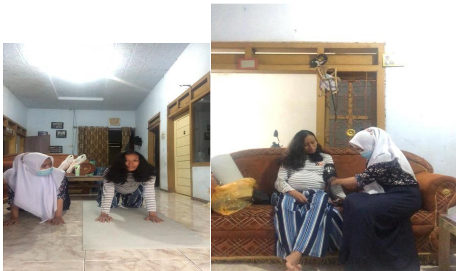
Kunjungan ANC Ke 3