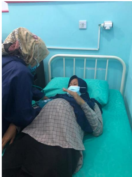
Kunjungan ANC Ke 1