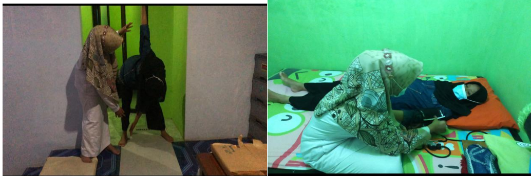
Kunjungan ANC Ke 2