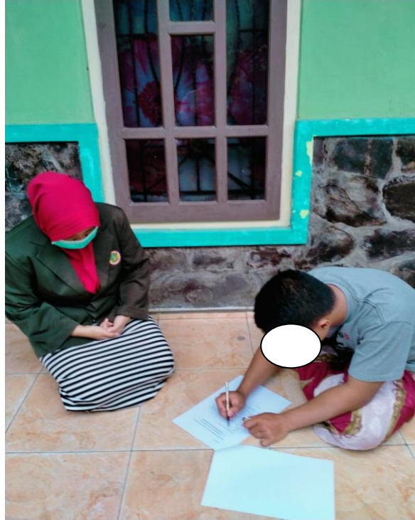
Gambar 1.1 Pengisian kuesioner