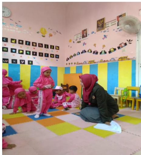
Gambar 1. Skrining sebelum senam bebek berenang dilakukan