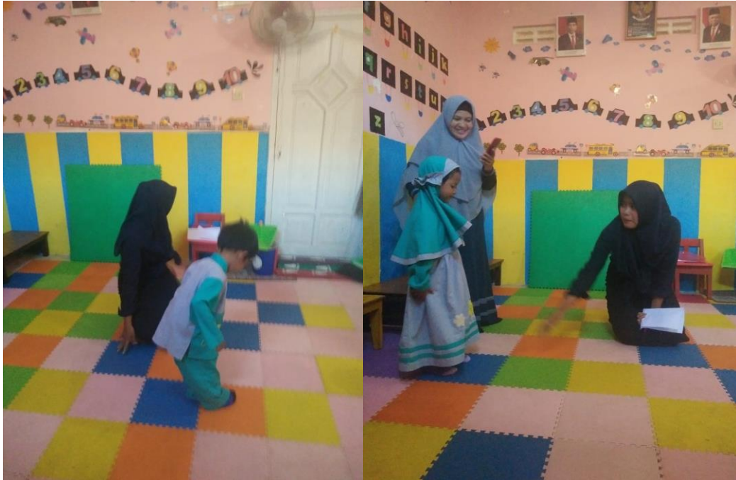
Gambar 6. Skrining setelah dilakukannya senam bebek berenang selama 4 kali