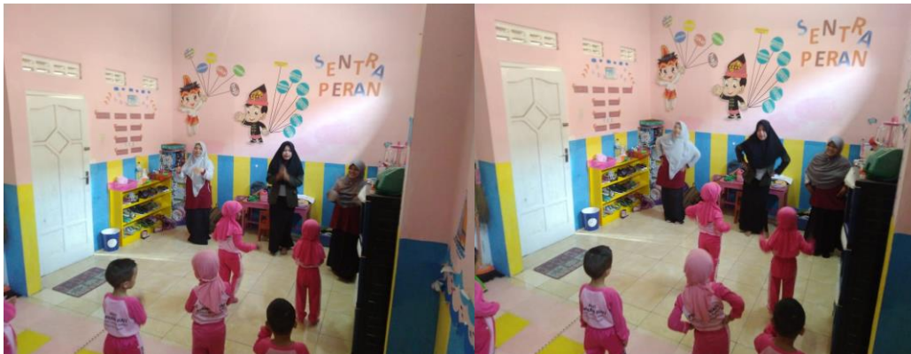
Gambar 2. Senam bebek berenang minggu ke 1