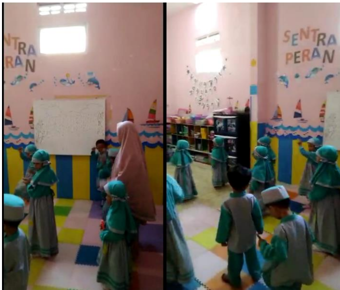
Gambar 5 Senam bebek berenang minggu ke 4