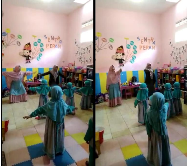
Gambar 4. Senam bebek berenang minggu ke 3