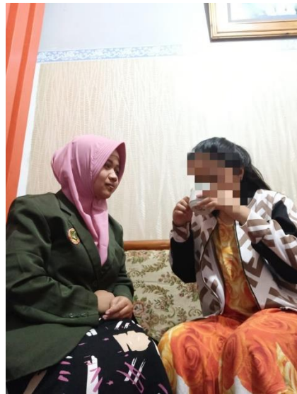
Peneliti Memberikan Teh Mawar Merah ( Rosa damascene ) dan Responden mulai Mengonsumsi