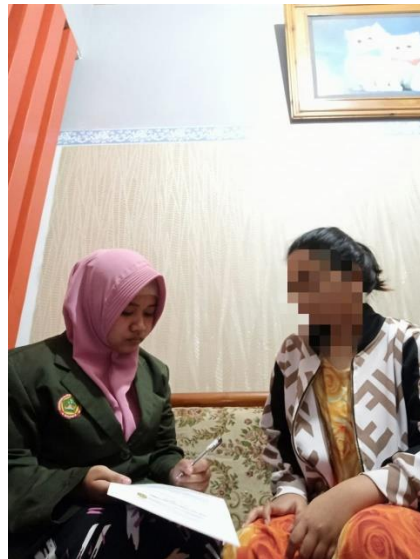
Peneliti Melakukan Informed Consent kepada Responden