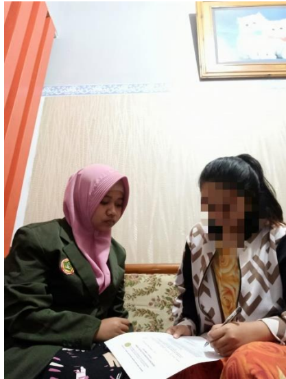
Responden Menandatangani Lembar Persetujuan sebagai Responden