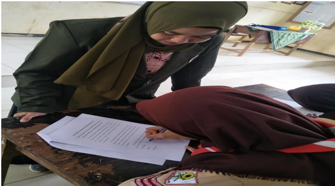
Pendampingan dalam pengisian inform consent