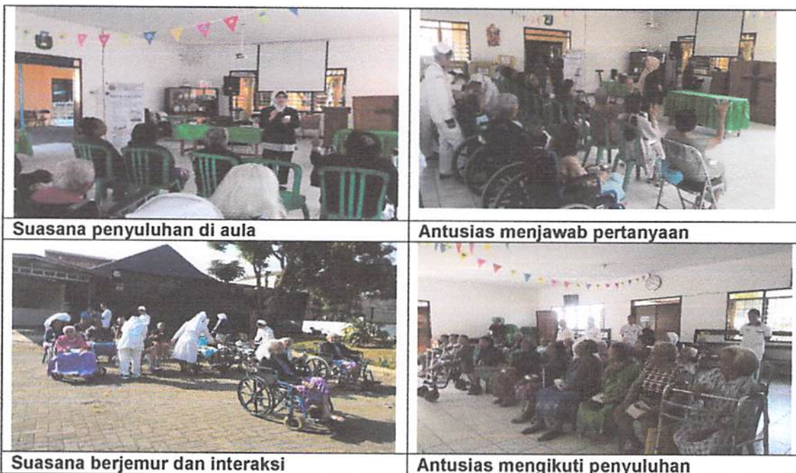
Suasana penyuluhan di aula

Kegiatan penyuluhan dilaksanakan pada tanggal 23 Juli 2019 yang diikuti oleh para lansia dan tenaga kesehatan yaitu perawat lansia beserta siswa magang dari instansi lain dengan total 50 orang. Melalui kegiatan tersebut, para lansia dan tenaga perawat semakin menyadari pentingnya pemahaman tentang kesehatan mental dan bagaimana melakukan tindakan-tindakan pencegahan kecemasan apabila terjadi pada lansia.