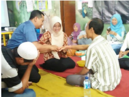
Gambar 4. Proses Pendampingan Praktik Penanganan Cedera dan Kondisi Ke darurat Pada Anak

Sebelum para peserta diajarkan praktik penanganan cedera dan kondisi ke darurat pada anak, peserta di lakukan pretest terlebih dahulu. Hal tersebut dilakukan untuk mengukur kemampuan dasar peserta sekaligus mengidentifikasi kesalahan-kesalahan yang sering dilakukan selama penanganan cedera dan kondisi ke darurat pada anak. Salah satu anggota Abdimas melakukan penilaian secara observasi dengan menggunakan SOP penanganan cedera dan kondisi ke darurat pada anak.