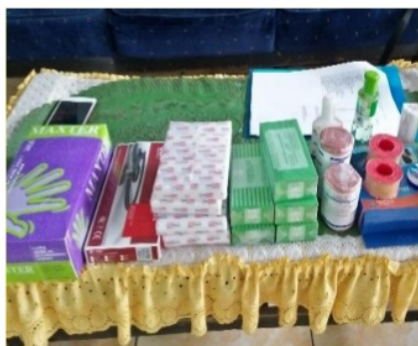
Gambar 6. Peralatan kesehatan

Kegiatan berikutnya adalah pengadaan barang berupa obat dan peralatan kesehatan sederhana dilakukan oleh tim abdimas selama kurang lebih dua minggu. Obat yang diberikan berupa obat luar untuk menangani luka dan beberapa obat sirup yang dijual bebas. Adapaun untuk peralatan kesehatan yang dimaksud adalah peralatan untuk rawat luka dan peralatan untuk menangani cedera sederhana, misalnya elastic bandage. Alat dan obat tersebut diharapkan dapat segera digunakan apabila ada kondisi cedera yang memerlukan pertolongan segera dari guru maupun pembina UKS.