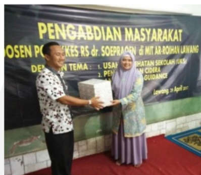
Gambar 7. Penyerahan obat dan peralatan kesehatan sederhana kepada mitra