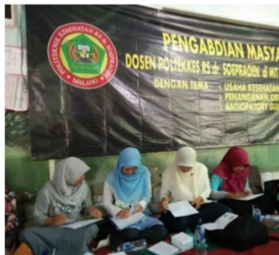
Gambar 2. Peserta Seminar Mengerjakan Pretest