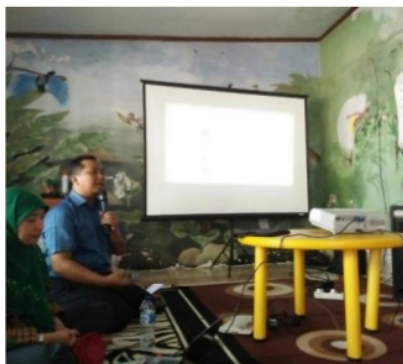
Gambar 1. Penyampaian materi seminar