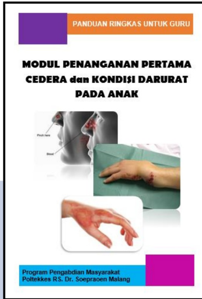
Gambar 6. Modul Penanganan Pertama Cedera dan Kondisi Darurat Pada Anak