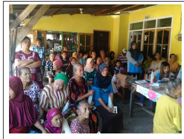
Peserta menyimak penyuluhan