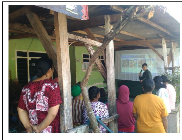
Penyampaian materi 1