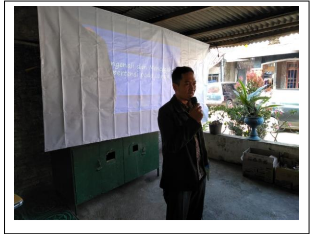
Sambutan pembukaan oleh Ketua Tim Pengabmas