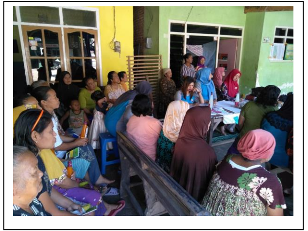
Penyampaian materi 1