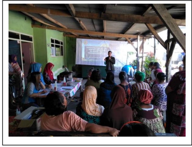
Penyampaian materi 2