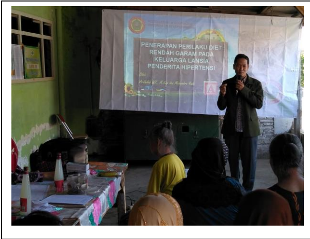
Penyampaian materi 2