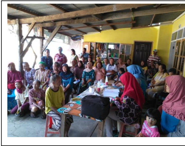
Peserta menyimak penyuluhan