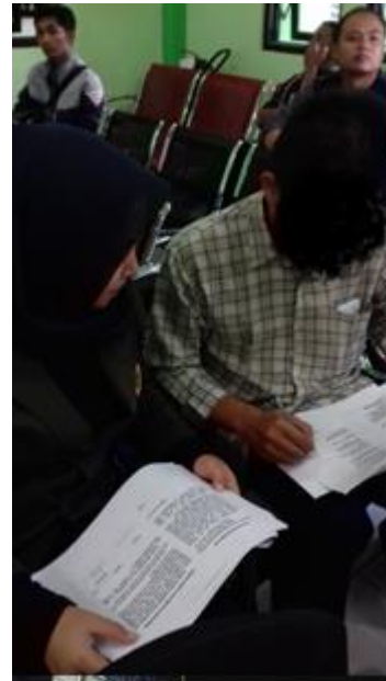
Gambar 12.2 Responden penelitian di poli umum Puskesmas Dinoyo Malang