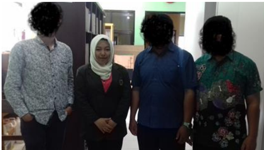
Gambar 12.3 Peneliti dan pengurus Puskesmas Dinoyo Malang