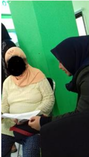
Gambar 12.1 Responden penelitian di poli umum Puskesmas Dinoyo Malang