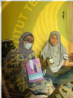
Gambar pemberian Teh Daun peppermint