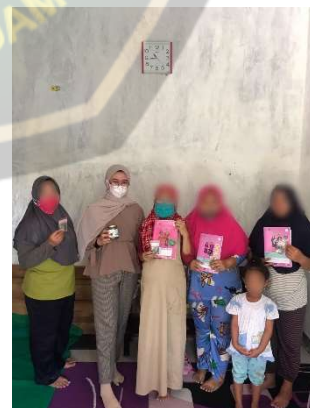
Gambar pemberian Teh Daun peppermint