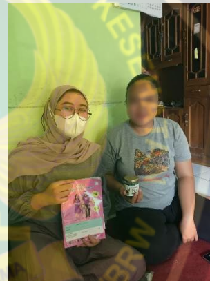
Gambar pemberian Teh Daun peppermint