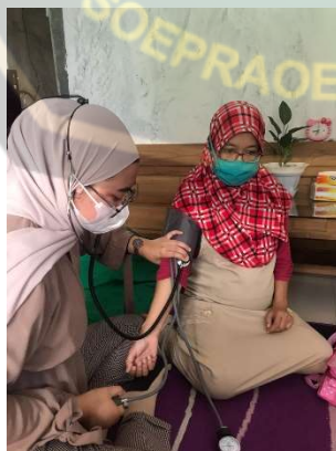
Gambar pemeriksaan tekanan darah pada ibu hamil