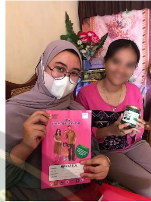
Gambar pemberian Teh Daun peppermint