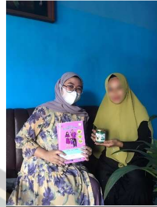
Gambar pemberian Teh Daun peppermint