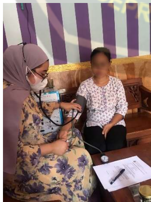
Gambar pemeriksaan tekanan darah pada ibu hamil