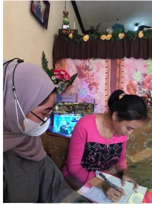
Gambar pengisian lembar responden

INSTITUT TEKNOLOGI, SAINS, DAN KESEHATAN RS DR. SOEPRAOEN KESDAM V/ BRAWIJAYA MALANG