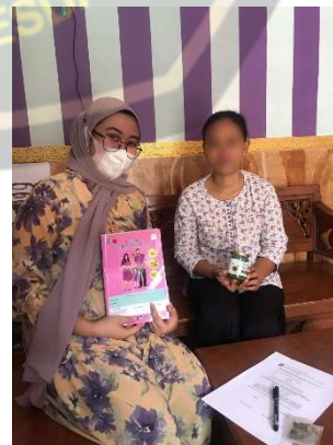
Gambar pemberian Teh Daun peppermint