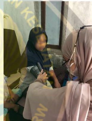
Gambar pemeriksaan tekanan darah pada ibu hamil