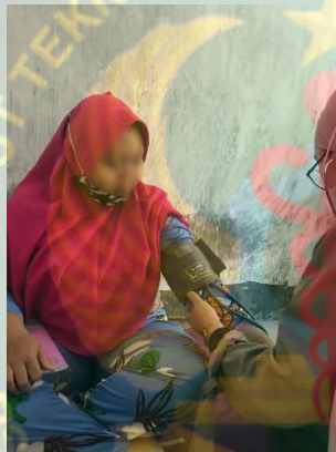
Gambar pemeriksaan tekanan darah pada ibu hamil