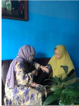
Gambar pemeriksaan tekanan darah pada ibu hamil

INSTITUT TEKNOLOGI, SAINS, DAN KESEHATAN RS DR. SOEPRAOEN KESDAM V/ BRAWIJAYA MALANG