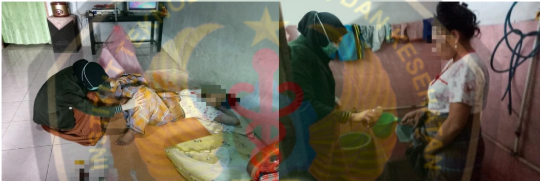
Gambar 4.1 Melihat luka jahitan perineum sebelum pemberian rebusan daun binahong