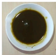
Gambar 1. Hasil Ekstrak Lidah Buaya

Sampel yang digunakan adalah 500 g daun lidah buaya ( Aloe vera L.) yang terlebih dahulu dihaluskan menggunakan blender. Tujuan dihaluskan adalah untuk meningkatkan luas permukaan sehingga penyarikan zat aktif pada proses maserasi lebih optimal (Kulsum & Sutriningsih, 2020). Hasil ekstrak yang diperoleh sebesar 32,4 g dan rendemen sebesar 6,48% dimana hasil rendemen memenuhi nilai ideal ekstrak, yaitu kurang dari 100%. Hasil ekstrak lidah buaya dapat dilihat pada Gambar 1.