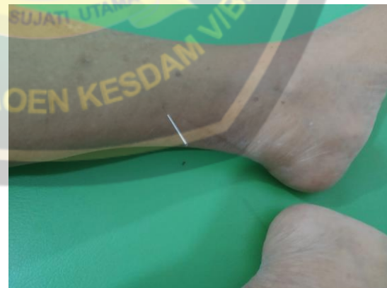
San Yin Jiao