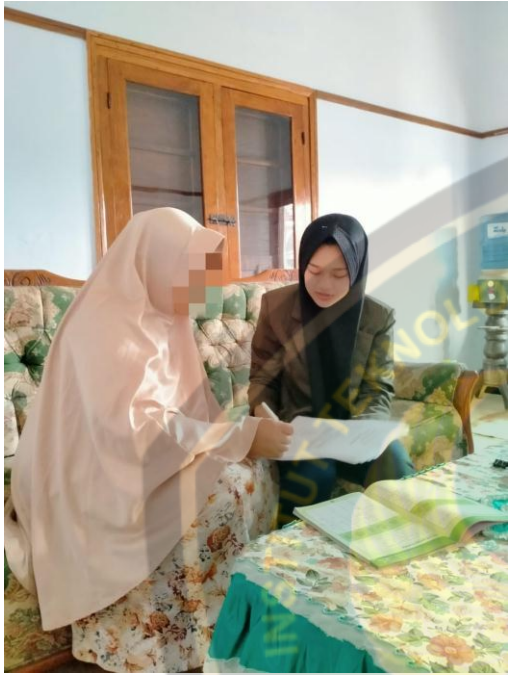
Gambar Pengisian Surat Persetujuan Dan Pengisian Kuisisioner