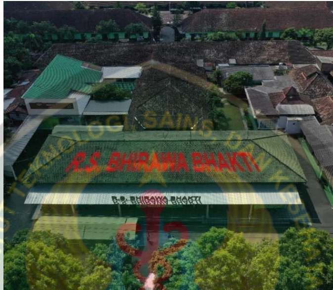
Gambar 4. 1 Profil Rumah Sakit RSBB tahun 2023

Rumah Sakit Bhirawa Bhakti adalah Rumah Sakit TNI AD dibawah Jajaran Denksyah 05.04.03 Malang. Rumah Sakit Bhirawa Bhakti sebelumnya adalah Balai Pengobatan pada akhir tahun 1980an. Seiring dengan perkembangan/kebutuhan Kesehatan Angkatan Darat tahun 2006 yang didalamnya terdapat Badan Prasarana Kesehatan Wilayah (Denksyah 05.04.03 Malang). Tahun itu, Rumkitban masih bernama Poliklinik Induk (Polin) dan menempati sebuah gedung tua peninggalan tahun 1926 di Jl. Panglima Sudirman E-20 Malang.