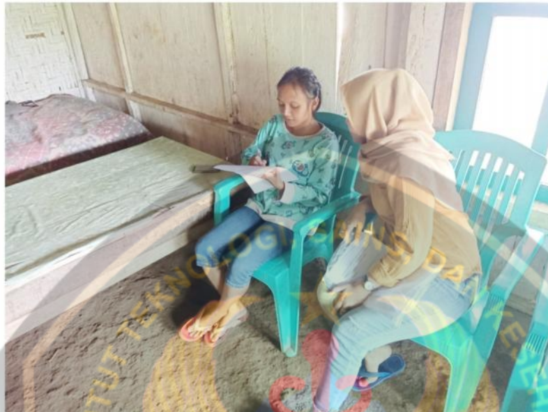
Menjelaskan inform consent kepada responden