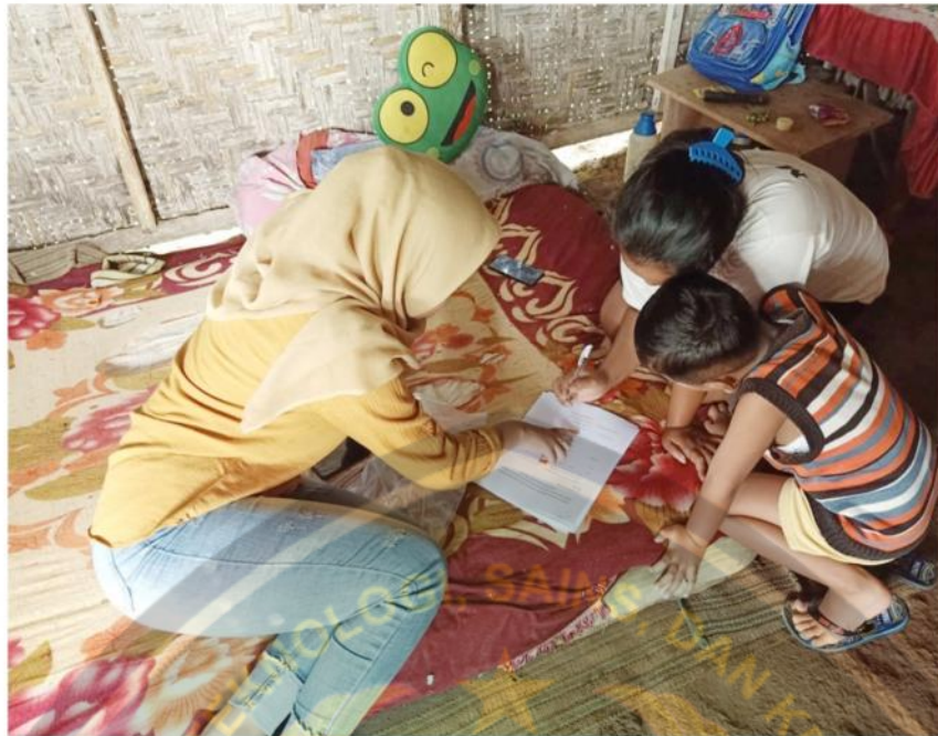
Menjelaskan kuisioner yang harus diisi