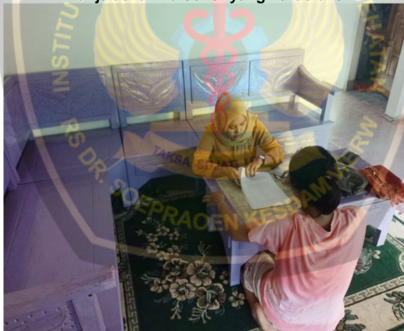
Menjelaskan bagian mana saja yang harus diisi oleh responden