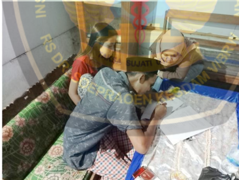
Mendampingi responden dalam pengisian inform consent