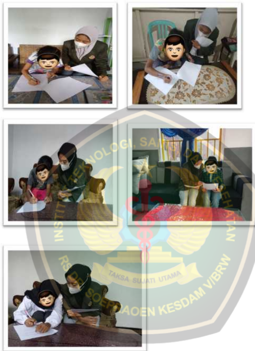
Gambar Pengisian Kuisisioner oleh Responden