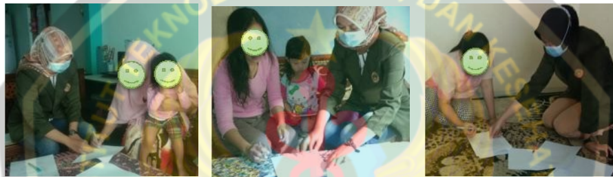
Menandatangani lampiran persetujuan menjadi responden