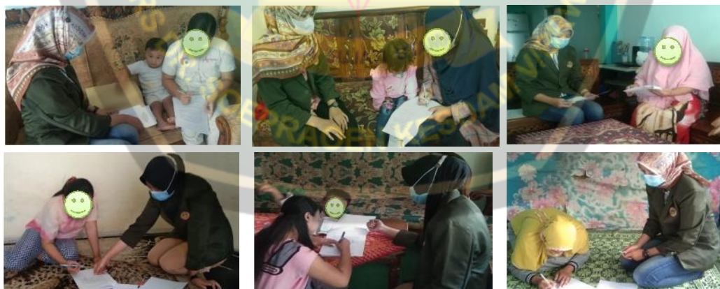
Pengisian Lembar kuesioner