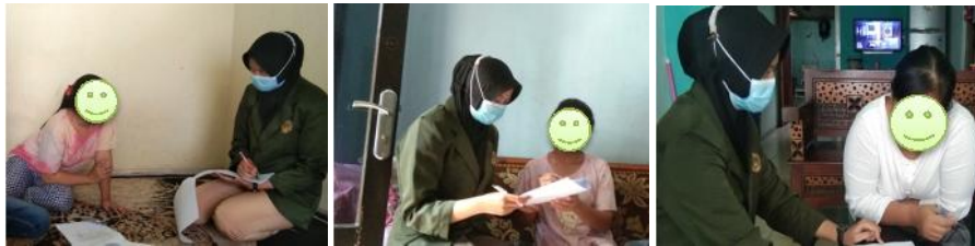
Menjelaskan maksud dan tujuan penelitian serta kesediaan menjadi responden