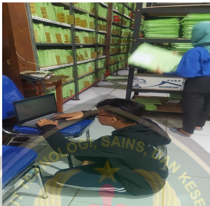
Studi pendahuluan dan ambil data