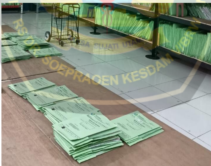
Berkas yang berisikan sertifikat kematian