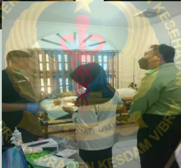
Gambar 9.2. Pendampingan pengisian kuisioner