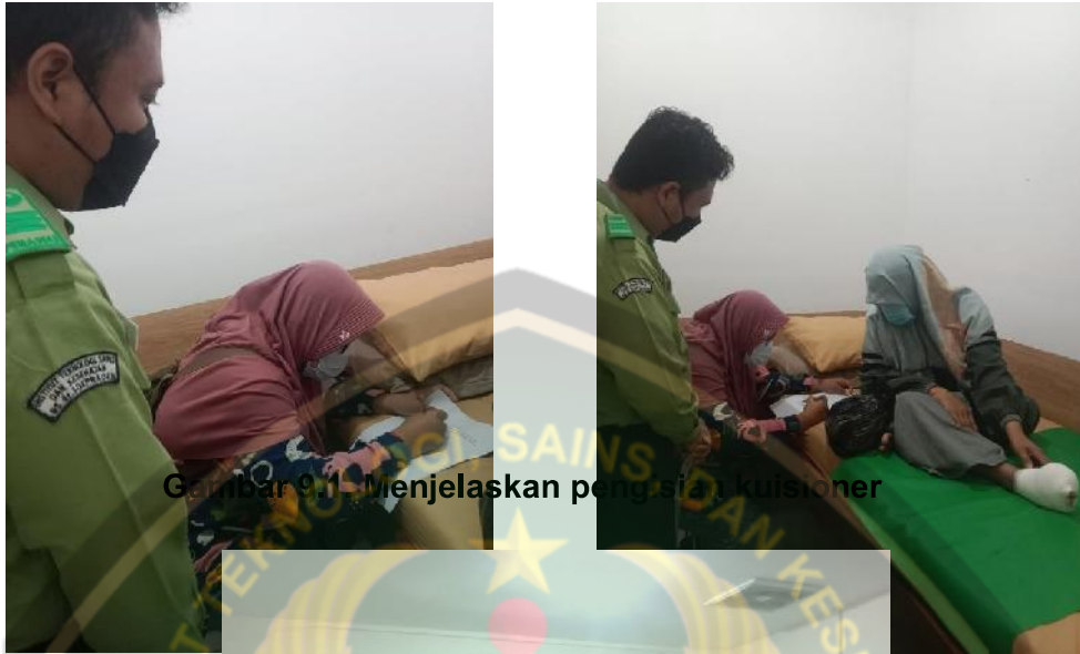
Gambar 9.1. Menjelaskan pengisian kuisioner