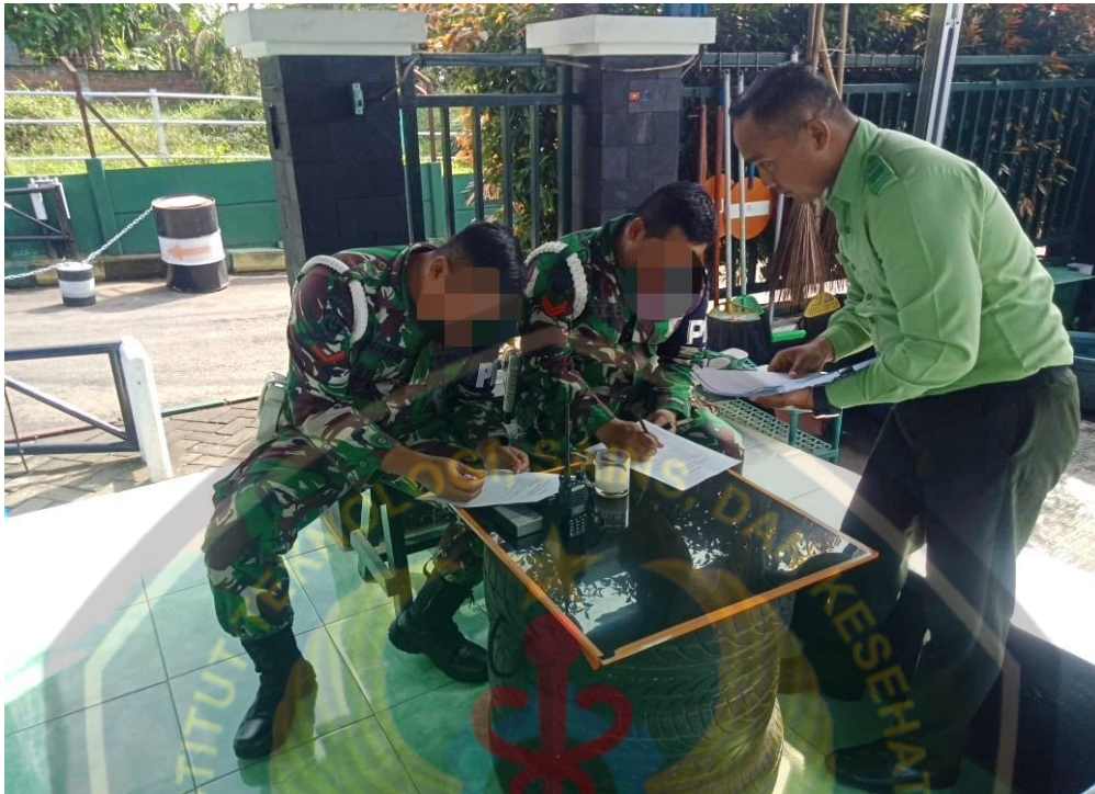
Mendampingi responden dalam pengisian kuisisioner