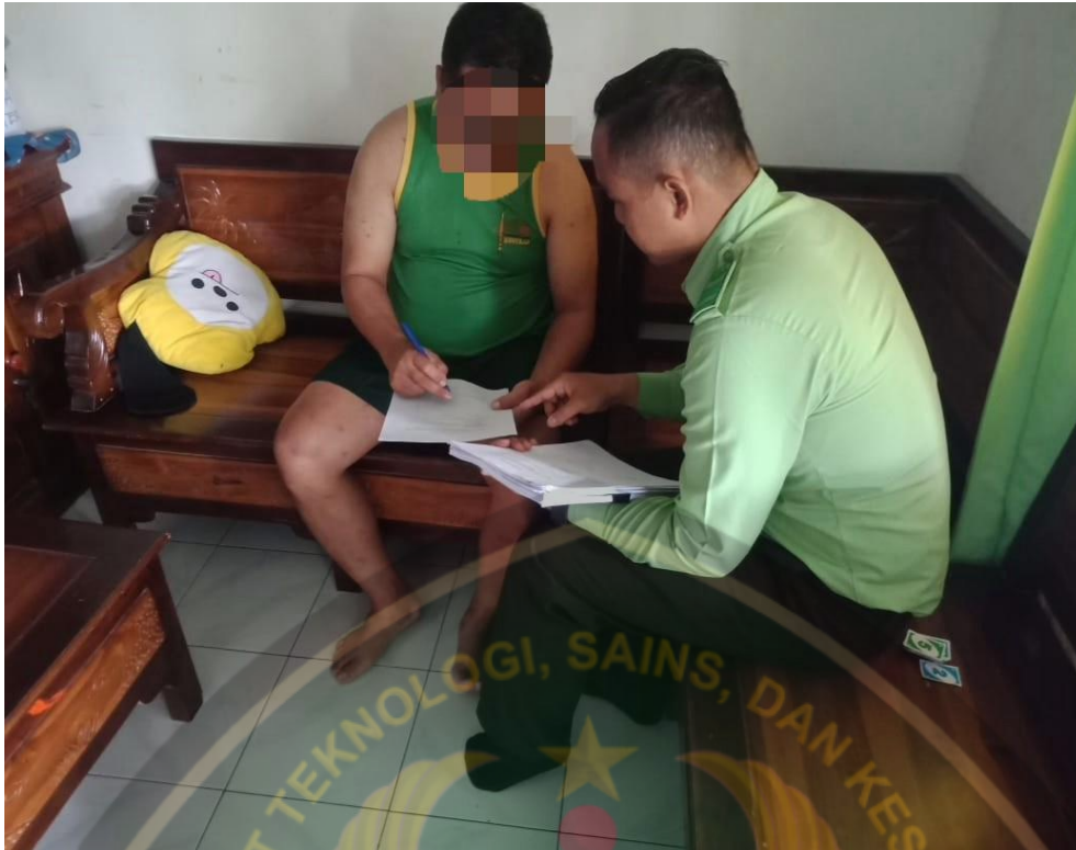
Mendampingi responden dalam pengisian kuisiomer