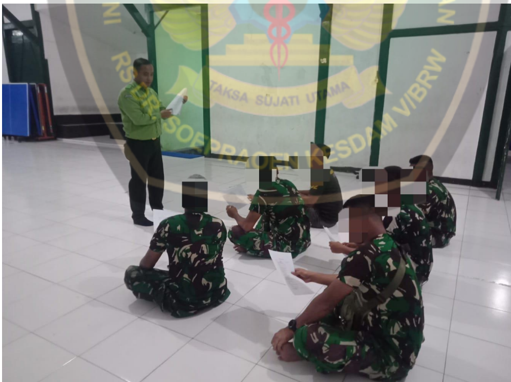
Menjelaskan cara pengisian kuisiomer