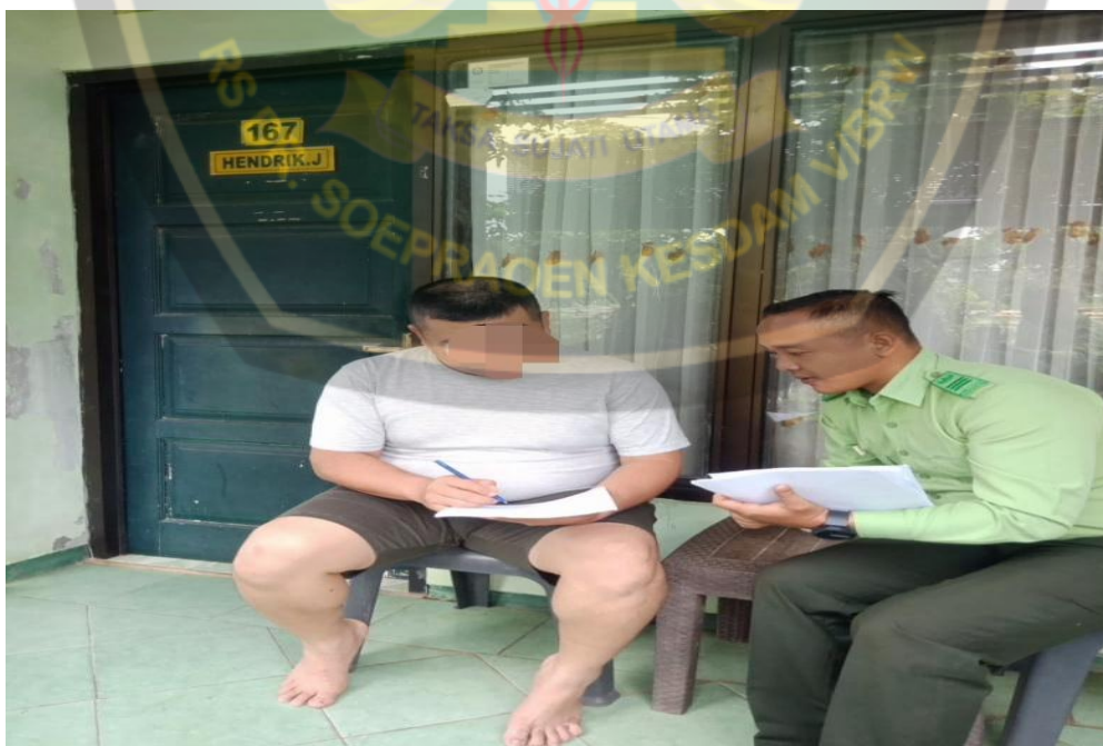
Mendampingi responden dalam pengisian kuisioer