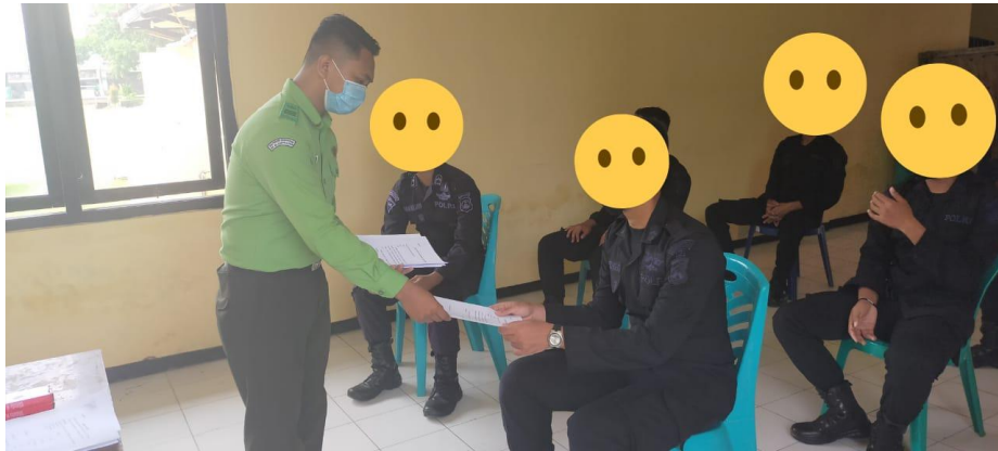
Gambar Pembagian Kuisisioner