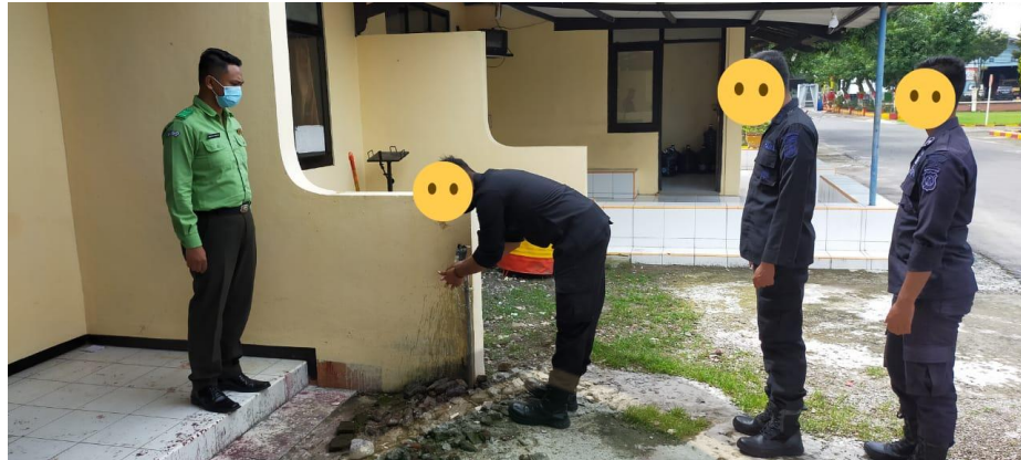
Gambar Cuci Tangan Responden