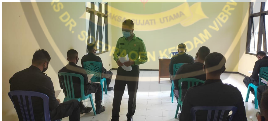
Gambar Pengisian Kuisisioner