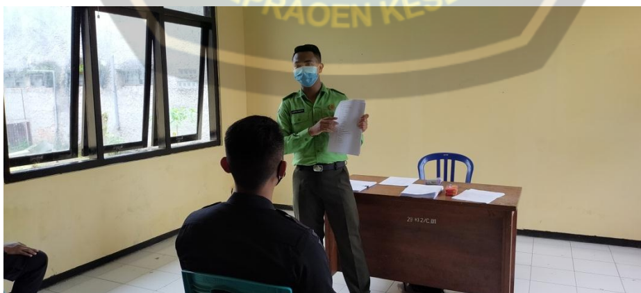
Gambar Penjelasan Penjelasan Cara Pengisian Kuisisioner