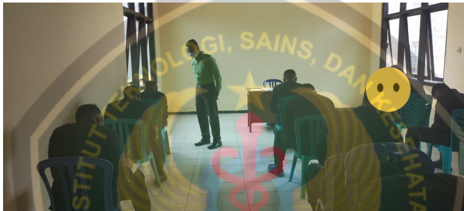
Gambar Pengisian Kuisisioner