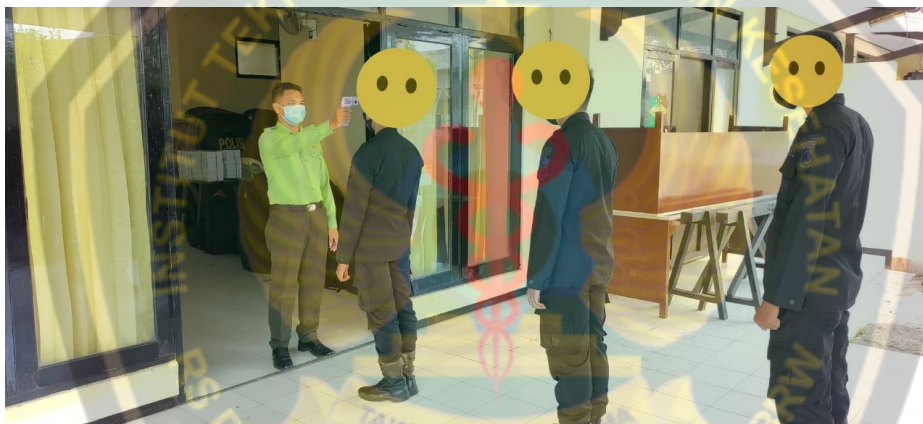
Gambar Pengukuran Suhu