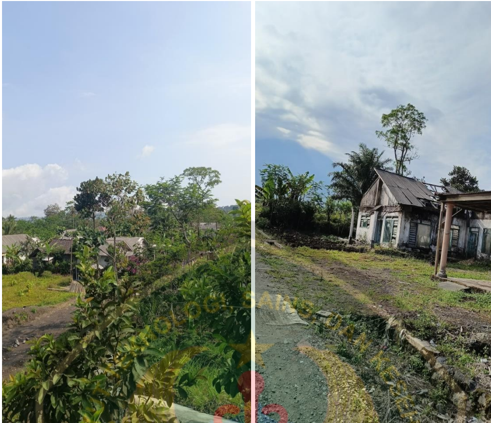
Gambaran lokasi rumah warga.