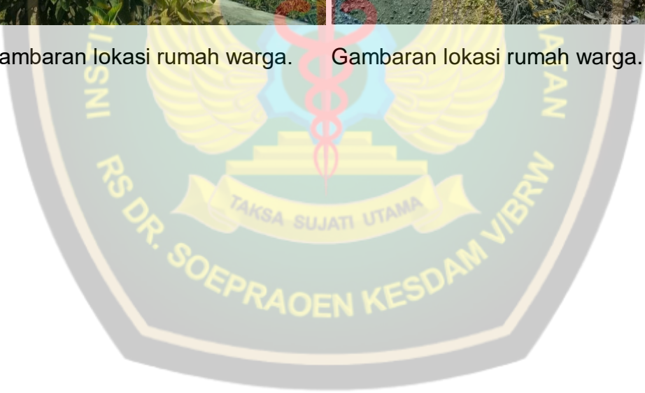
Gambaran lokasi rumah warga.