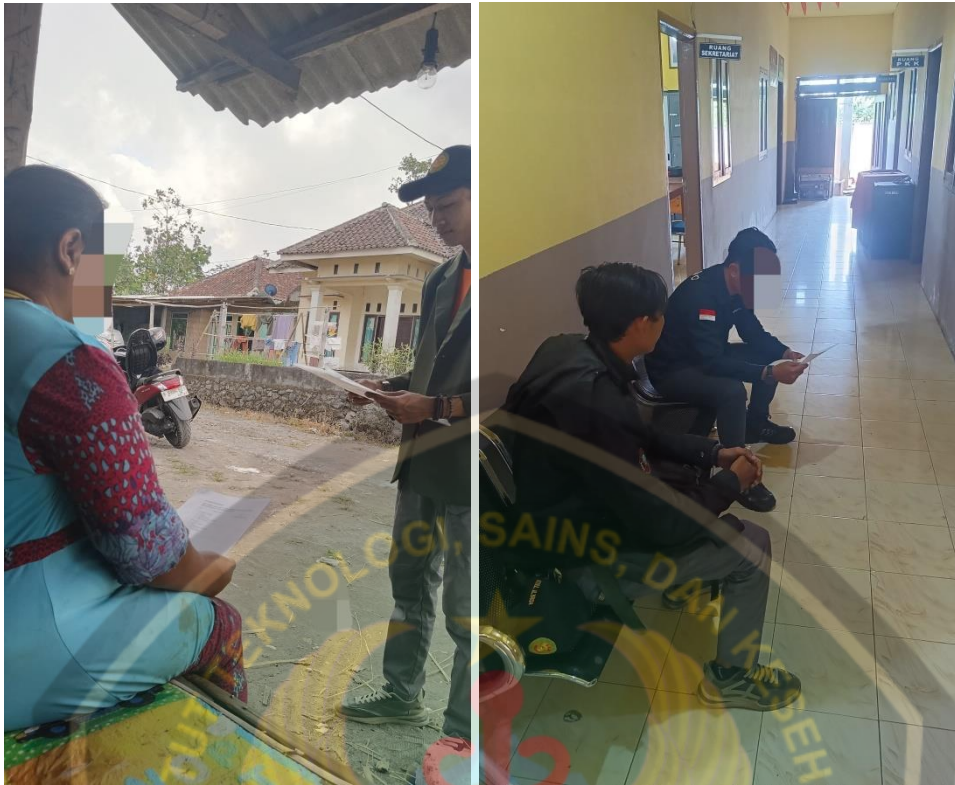
Pengisian kuisisioner oleh klien. Menemui perangkat desa untuk ijin penelitian.