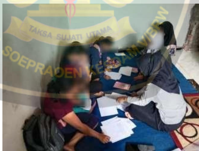
Pendampingan Pengisian Kuesiner