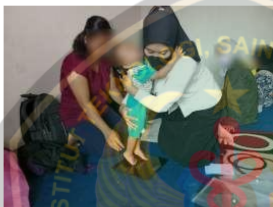
Mengukur Timbang Balita