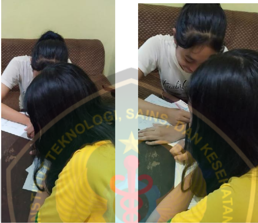
Ket. Gambar : Pengisian lembar kuisisioner penelitian oleh responden