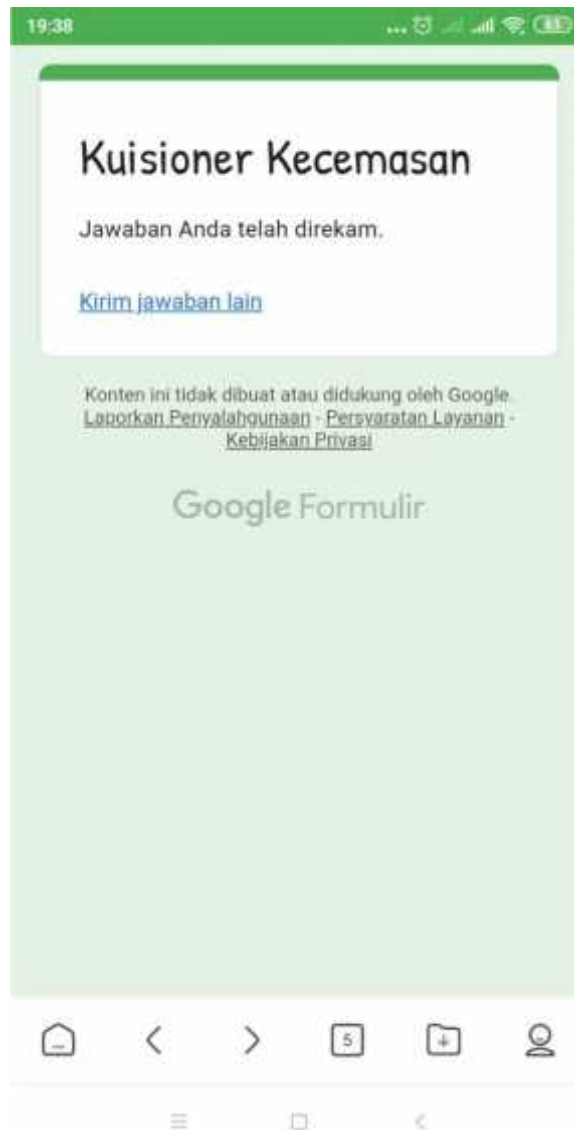
Gambar Pengumpulan Kuisiner