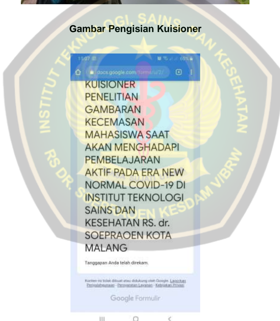
Gambar Pengumpulan Kuisisioner