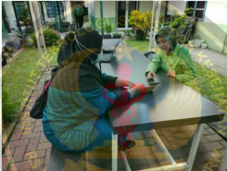
Gambar Menjelaskan Cara Pengisian Kuisisioner