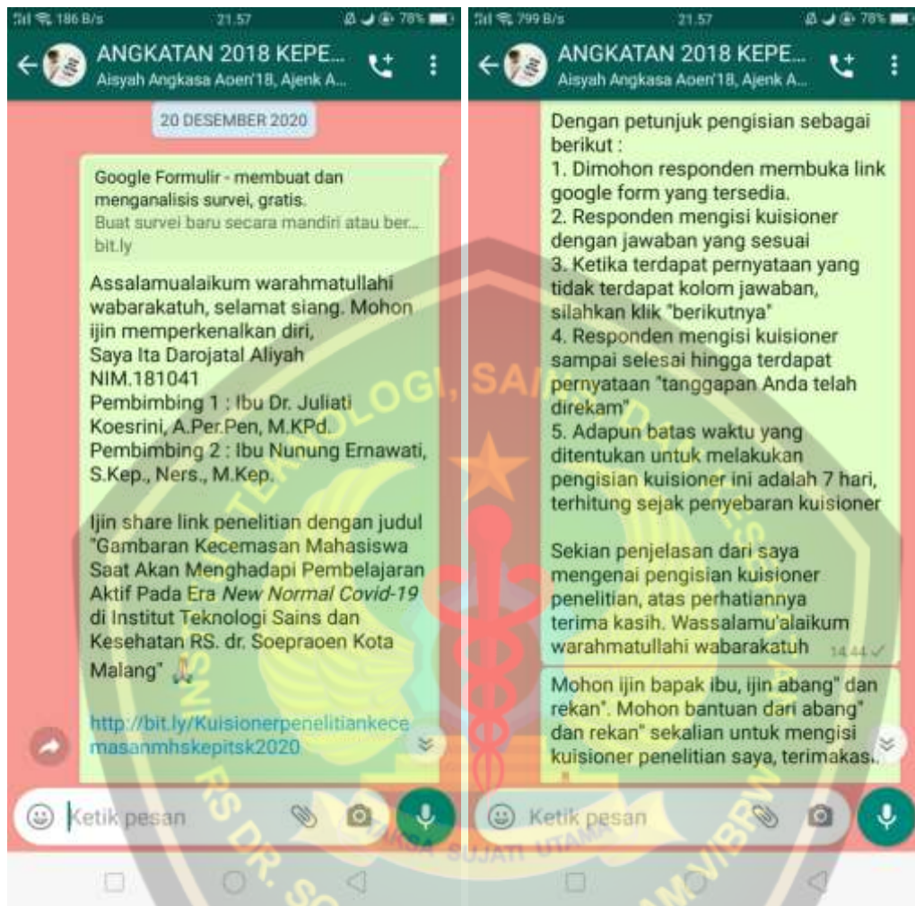
Gambar Screenshot Pembagian Kuisiонер dan Penjelasan Cara Pengisian Kuisiонер