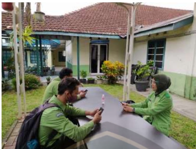
Gambar Pengisian Kuisisioner