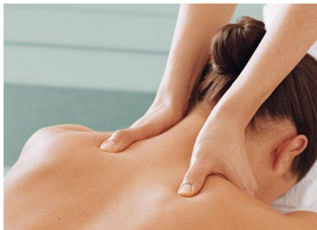
Gambar 2.1 : Back Massage

Back massage adalah tindakan massage yang dilakukan pada bagian punggung dengan usapan yang perlahan selama 3-10 menit (Potter & Perry, 2005). Masase punggung atau sering diistilahkan effleurage atau back massage merupakan teknik yang sejak dahulu digunakan untuk meningkatkan relaksasi dan istirahat. Riset menunjukkan bahwa masase punggung memiliki kemampuan untuk menghasilkan respon relaksasi (Berman, 2009). Massage punggung ini dapat menyebabkan timbulnya mekanisme penutupan terhadap impuls nyeri saat melakukan gosokan punggung yang dilakukan dengan lembut.