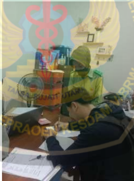
Gambar 8.2. Mendampingi untuk pengisian kuisisioner