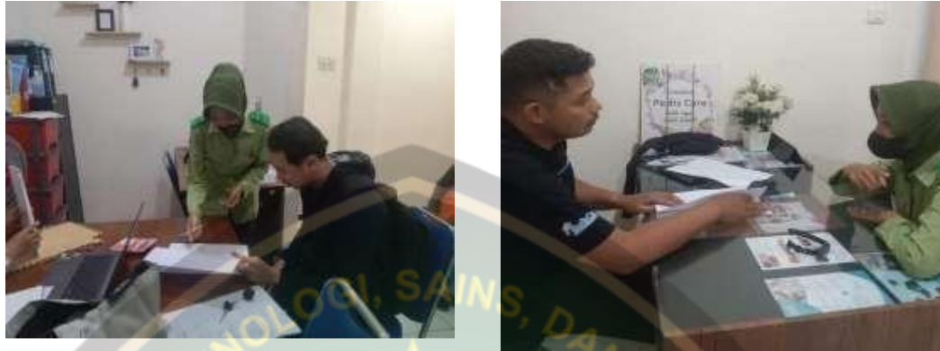
Gambar 8.1. Menjelaskan pengisian Kuisisioner