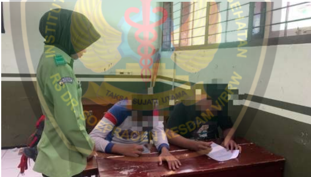
Peneliti memantau pengisian kuesioner responden