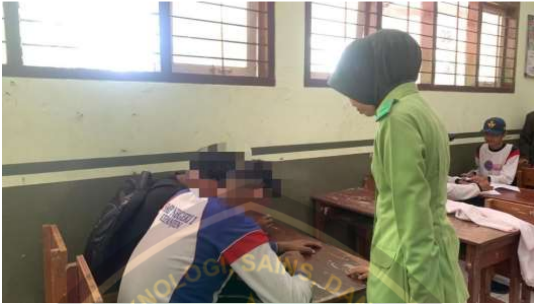
Peneliti memantau pengisian kuesioner responden