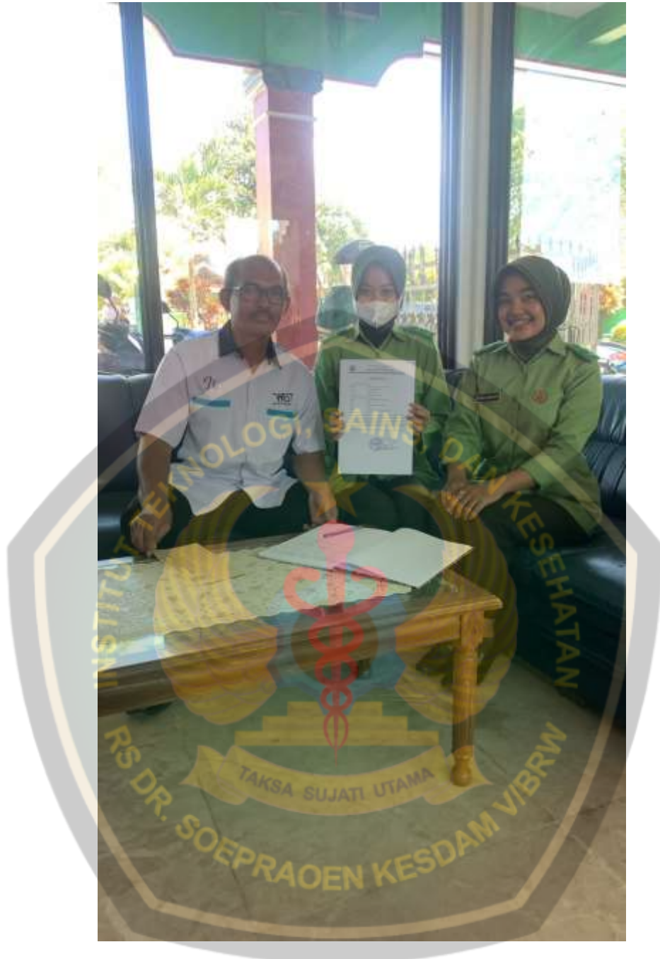
Dokumentasi dengan kepala sekolah SMPN 1 Kapanjen