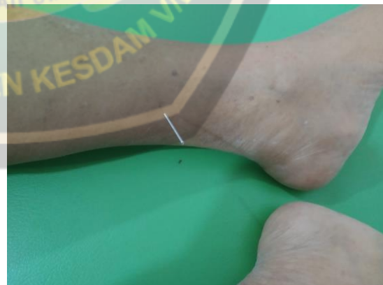
San Yin Jiao