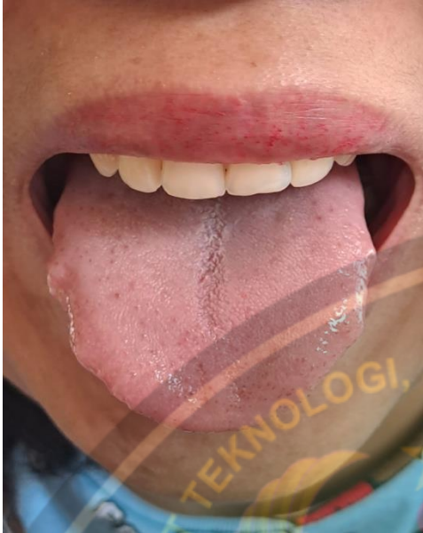
Kondisi lidah pasien sebelum terapi