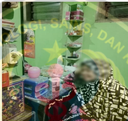
Gambar Pemberian Aromaterapi Cendana Pada Ibu Menopause