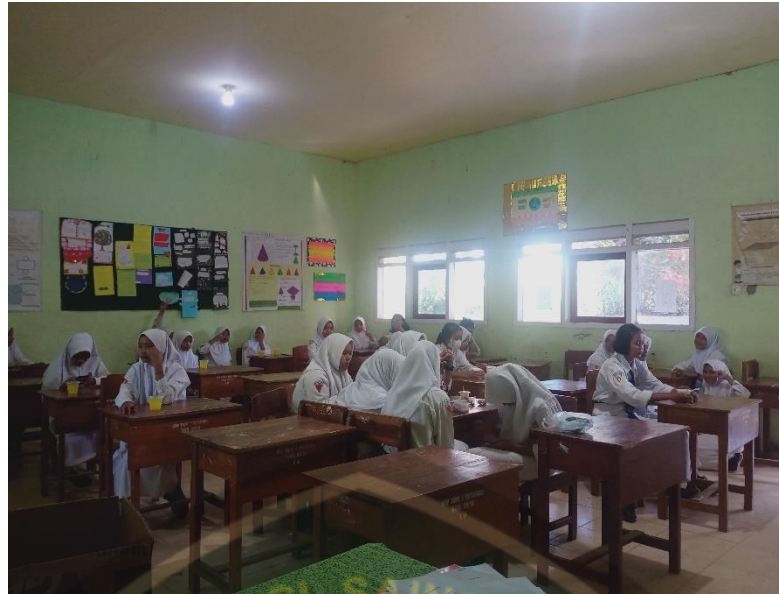
Gambar saat pemberian jus nanas