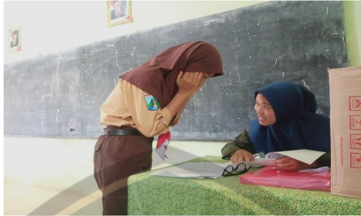
Gambar saat observasi responden

ISTITUT TEKNOLOGI SAINS DAN KESEHATAN RS dr.SOEPRAOEN PROGRAM STUDI SARJANA KEBIDANAN