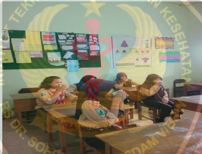
Gambar saat responden minum jus nanas