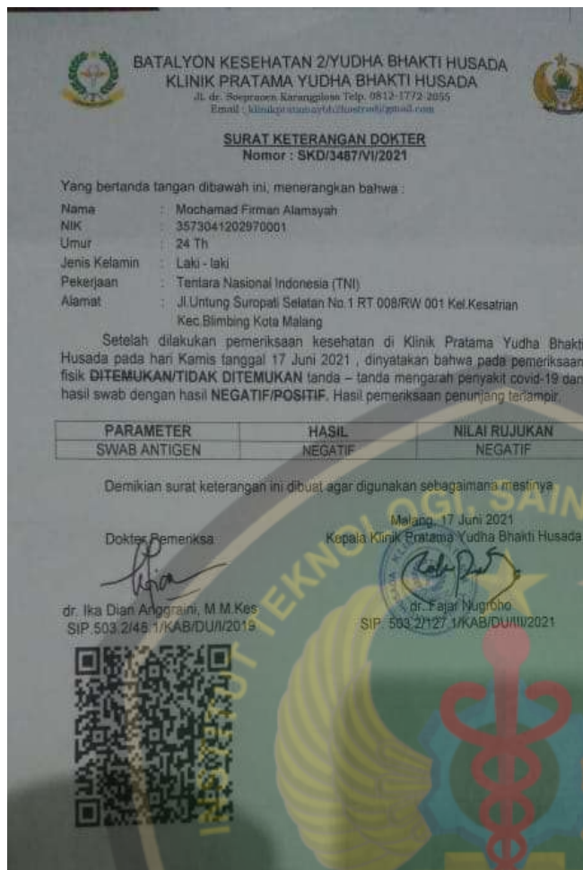
Gambar 1. Hasil Test Rapid Antigen