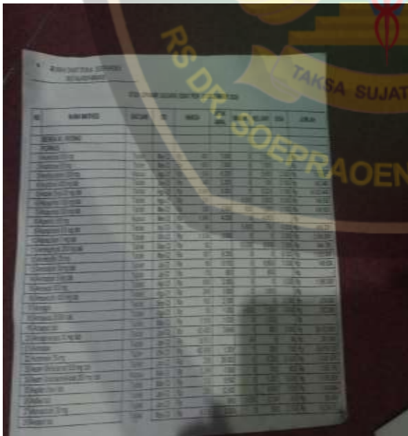
Gambar Stok Opname Gudang Obat di Rumah Sakit dr. Soepraoen Kota Malang