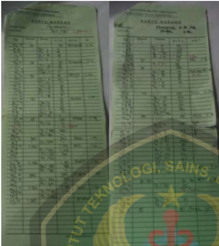
Gambar pengambilan data melalui kartu stock