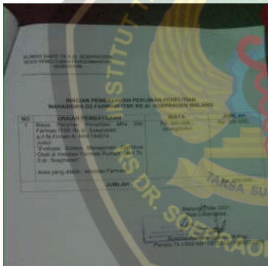
Gambar 2. Administrasi Penelitian