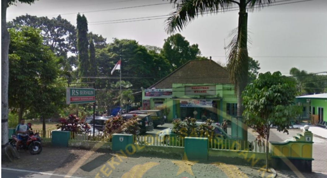
Gambar 4.1 Gambar Lokasi Penelitian

Penelitian ini dilakukan di Rumah Sakit Bantuan Rampal yang berada di Jalan Panglima Sudirman No.E20, Kesatrian, Kota Malang. dengan kepadatan penduduk yang cukup tinggi yaitu dengan jumlah penduduk 5697 jiwa. Secara umum tingkat pendidikan masyarakat relatif tinggi mengingat letak rumah sakit yang masih berada di dalam kota serta perekonomian masyarakat sekitar termasuk dalam golongan menengah ke atas karena rumah sakit juga berada di deretan kompleks perumahan Anggota tentara.