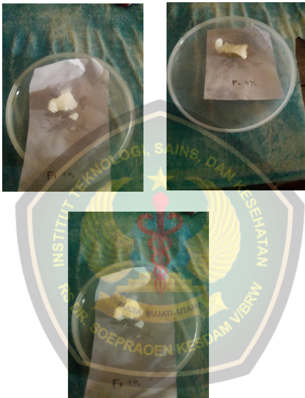
Lampiran 4 Dokumentasi Hasil