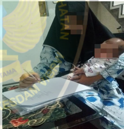
Gambar 4. Responden mengisi kuesioner