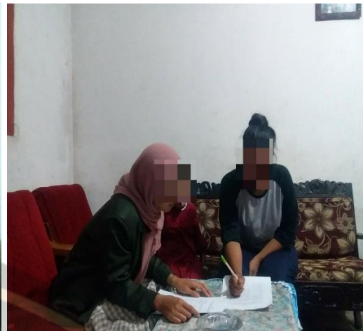
Gambar 2. Pendampingan saat pengisian kuesioner oleh responden