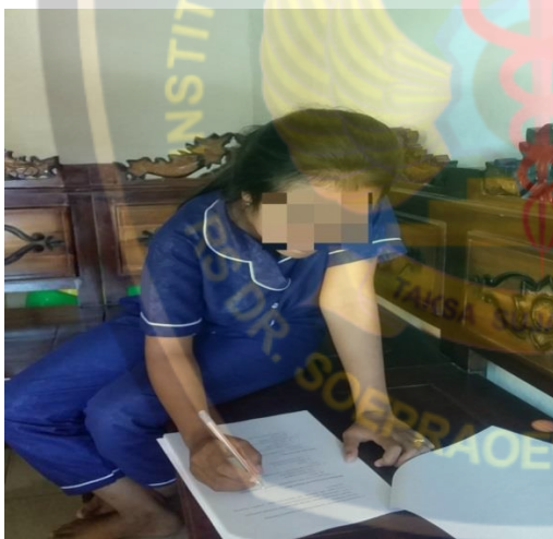
Gambar 3. Responden mengisi kuesioner