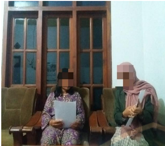
Gambar 1. Menjelaskan Prosedur pengisian kuesioner kepada responden