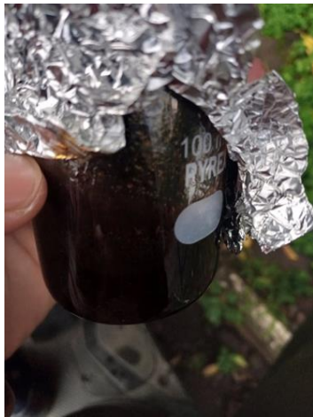
Ekstrak daun jambu biji