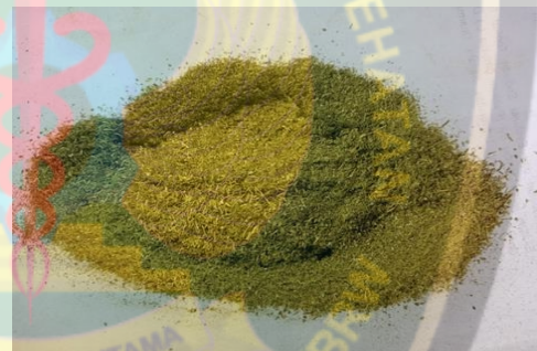
Serbuk daun jambu biji