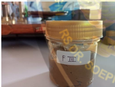
Sediaan jadi losion