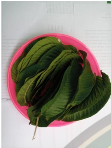
Daun Jambu biji