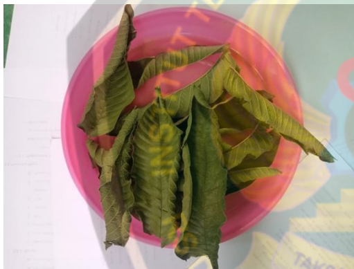
Daun jambu biji kering