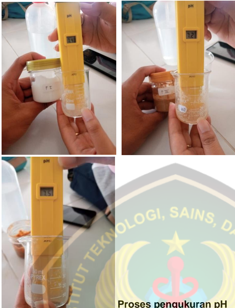
Proses pengukuran pH