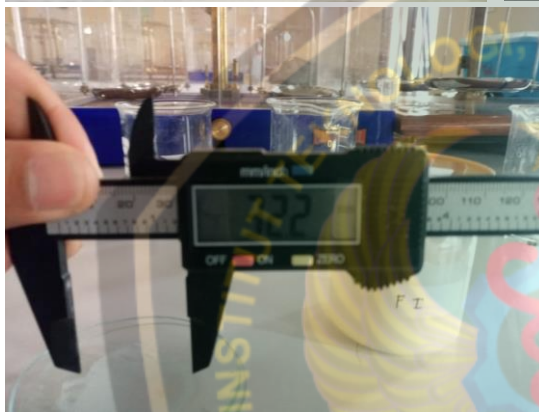
Proses uji daya sebar losion