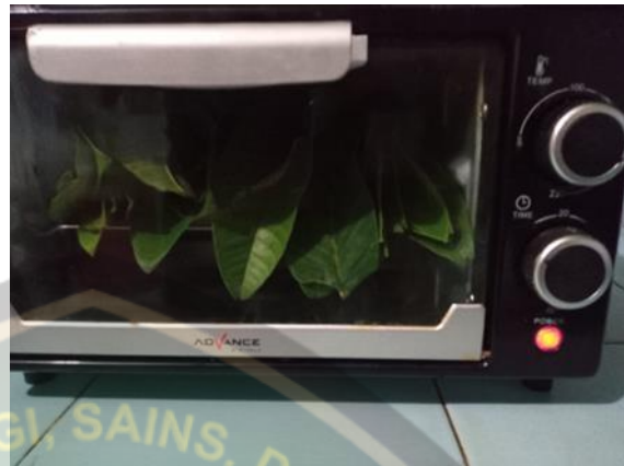
Proses pengerigan daun jambu