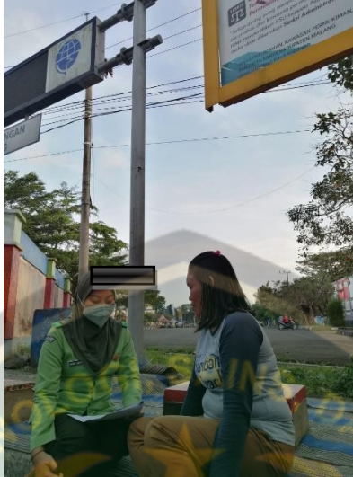
.Gambar 1. Peneliti menjelaskan maksud dan tujuan peneliti pada salah satu responden