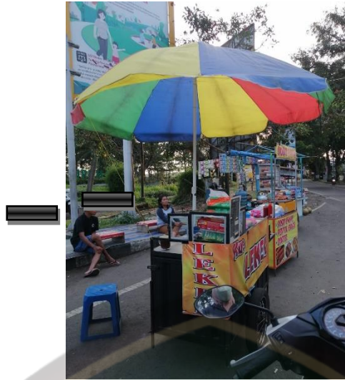
Gambar 3. Kondisi jenis pedagang kaki lima yang berjualan di lokasi penelitian Stadion Kanjuruhan Kapanen