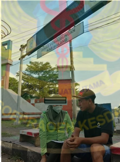
Gambar 2. Peneliti menjelaskan cara mengisi lembar check list pada salah satu responden