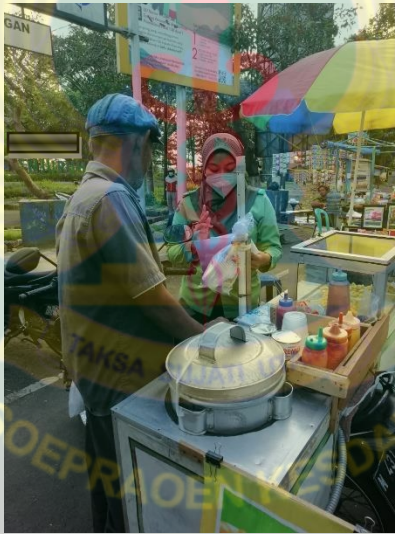
Gambar 4. Peneliti menjelaskan maksud dan tujuan peneliti pada salah satu responden