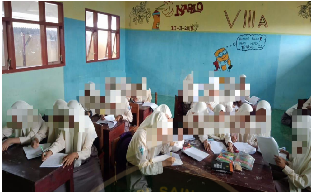
Responden sedang mengisi kuesioner