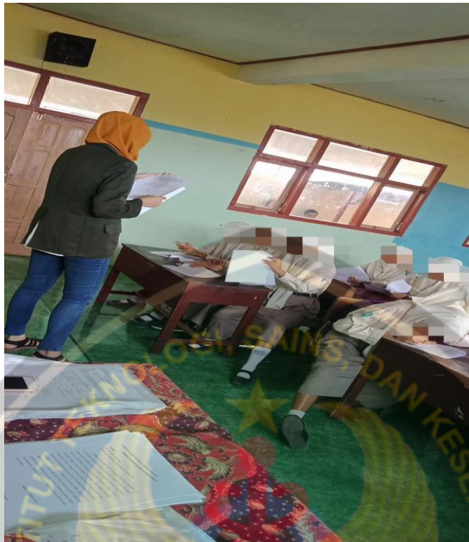
Meminta izin kepada responden