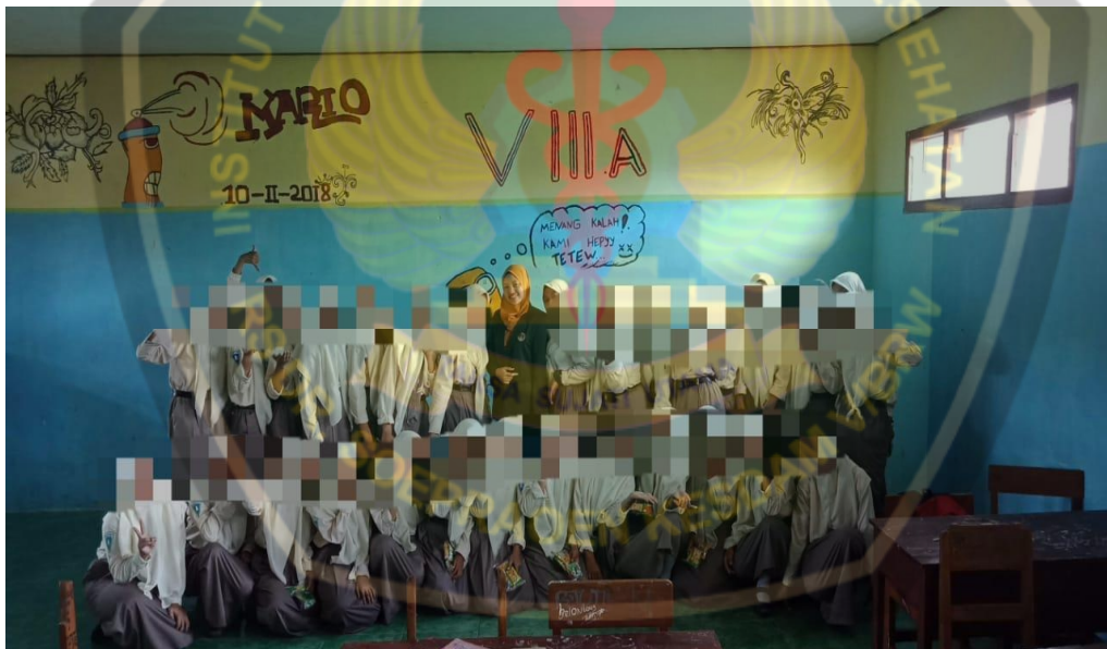
Foto bersama responden