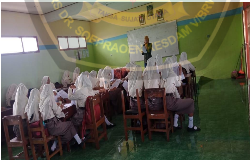
Penjelasan Kuesioner kepada responden